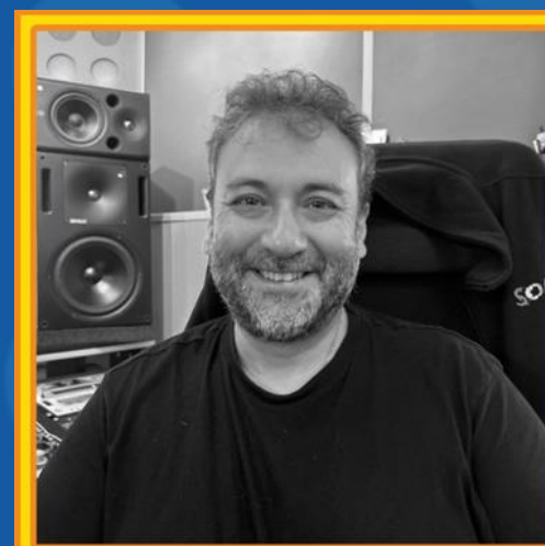
Fran Gude Diseño de sonido